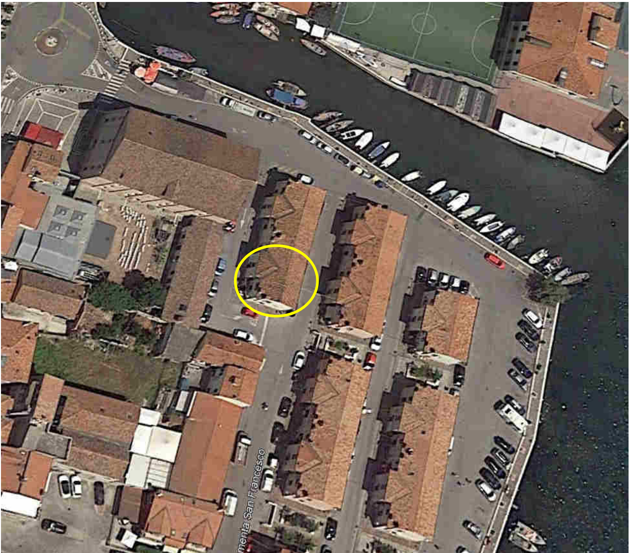
Immagine da satellite